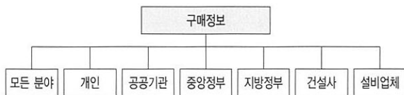
[그림 4] Wrap의 구매정보 수록 대상

하지만 유럽의 여러 나라 중에서 영국의 건설폐기물 재활용률은 현재 45% 정도로 유럽에서 가장 건설폐기물의 재활용률이 높은 네덜란드나 덴마크에 비하여 절반 정도의 수준이 미치지 못하고 있다. 따라서 Wrap을 활용한 건설폐기물 재활용을 활성화하여 궁극적으로 영국에서 건설폐기물이 방치되거나 활용되지 못하는 현상이 발생하지 않는 것을 목표로 설정하여 정책을 추진하고 있다.