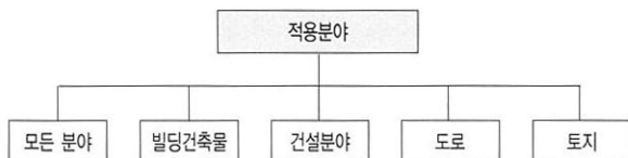
[그림 5] Wrap의 적용분야 수록 대상