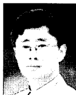
이 일 주

1988년 아주대학교 전자계산학과(공학사) 1994년 한양대학교 전자계산학과(공학석사). 2002년 아주대학교 컴퓨터공학과(박사수료). 1989년-1998년 현대미디어시스템/현대정보기술 책임. 1998년-현재 동원대학 모바일컨텐츠과 조교수. 관심분야는 정보검색 시스템, 모바일프로그램