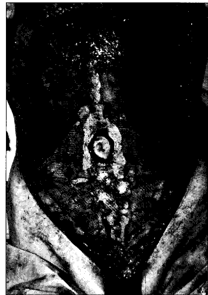
Fig. 2. Intraoperative view after polypropylene mesh application. Nearly whole abdominal dissected area was covered with polypropylene mesh. Polypropylene mesh was fixed on abdominal wall with 1-0 absorbable suture.