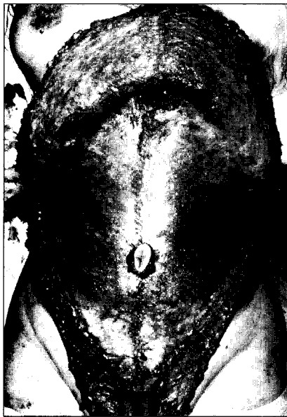
Fig. 1. Intraoperative view after abdominal muscle plication. Transverse mattress suture was preformed previously and then continuous suture was performed.

42명의 환자 중 배곧은근피판의 공여부와 관련된 합병증을 보인 경우는 양측성 배곧은근피판으로 유방을 재건한 1례에서 경미한 복부의 부푼(bulging)을 보였을 뿐 탈