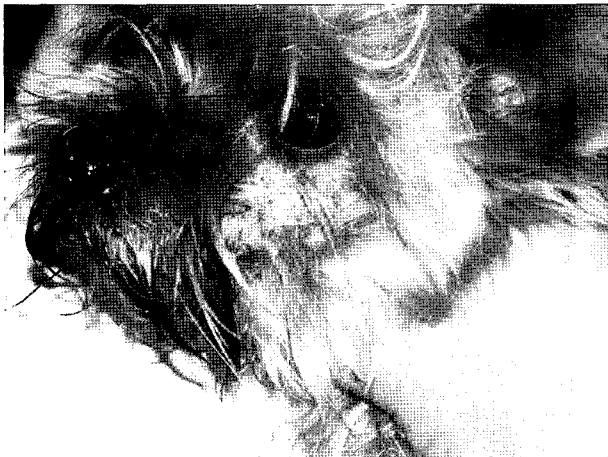
Fig 1. There was the swelling and crust caused by exudates on the left suborbital lesion.