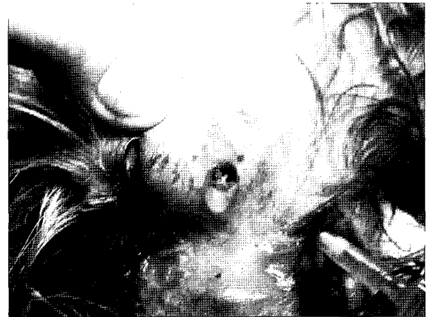
Fig 4. The sinus tract was probed and drained with 0.05% chlorhexidine solution.

매우 심한 상태였다. 또한 안외부위에서는 출혈성 삼출물이 지속되었다. 치아의 동요도 검사에서 견고하였고, 치근의 골절소견은 확인할 수 없었다.