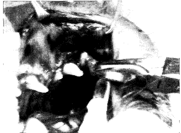
Fig 3. The left fourth maxillary premolar tooth was extracted by tooth sectioning.