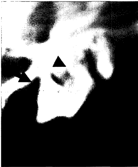
Fig 5. A lateral radiograph of the maxillary fourth premolar reveals radiolucent (arrow) and indistinct margin (arrowhead) in the 4th premolar tooth root region.

내원하였다. 병력청취를 통하여 내원 2일전에 갑작스런 안와부위의 종창과 누관이 형성되었고, 병변부위에서 농성 삼출물이 배출되었음을 확인할 수 있었다. 신체검사에서 좌측 하악 림프절이 상당히 종창되어 있었고, 병변부위에 심한 통증을 호소하였다. 구강검사에서는 치은염이 심한 상태였고, 좌측 제4전구치 부위의 치은 압박 시 출혈성 농이 삼출되었다. 치아는 견고한 상태였고, 치근의 골절소견은 보이지 않았다. 치아의 방사선�촬영을 실시한 결과, 4번째 전구치의 치근주위에 방사선 투과도가 증가되어 있었고, 앞쪽 치근주위에는 삼출물로 인한 불분명하고 혼탁한 영상을 확인할 수 있었다(Fig 5).