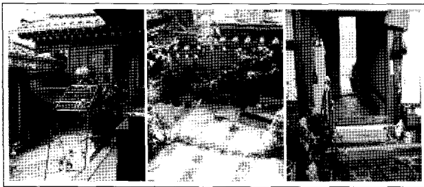
사진 3. 안마당 공간의 용도

마당 공간의 장점을 순위별로 3가지를 질문 한 결과 1 순위로는 50%의 응답자가 “시각적인 개방감과 햇빛이 잘 들고 통풍이 용이하며, 하늘을 볼 수 있어서 좋다”, 2순위로는 ‘꽃과 채소를 키울 수 있다’를 마당의 장점으로 선택하고 있다. 전체적으로는 마당공간의 장점으로 시각적 개방감(34%), 김장 및 건조장소(15.1%), 채소와 꽃밭 그리고 놀이와 운동 공간(13.2%)을 들고 있다. 마당공간의 단점으로는 청소 불편(45%), 출다(40%) 그리고 수납공간의