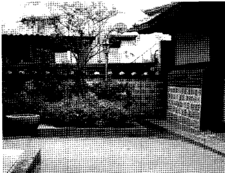
사진 1. 마당 전경