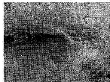
B: Habitat of fish