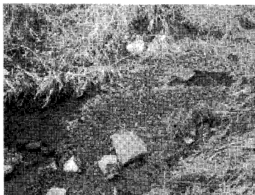
B: Green leaves in winter