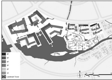
건축 높이 계획

- 강에 가까워질수록 레벨이 낮아지는 계획: 시선의 트임 및 접근성 강조