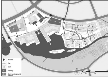
교통 및 주차계획