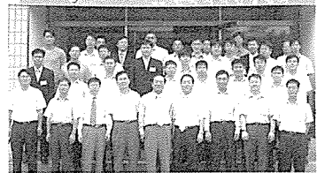
집단에너지 (Integrated Energy) 2005 경영·기술전문과 Workshop

우리협회의 교육훈련 및 연구개발사업의 일환으로 집단에너지산업 경영, 기술전문과과정 첫 워크숍이 7월 6-7일 이틀간의 일정으로 한남의 강남 교육훈련실에서 열렸다. 집단에너지사업의 전문분야별 12개 과목에 대한 강의를 주로 실시한 이번 워크숍은 32개 에너지사업체에서 65명이 참여하였고 WORKshop 대한 평가 토론이 있었으며 수강자 전원에게는 협회에서 발행한 전문교육과정 수료증이 수여되었다.