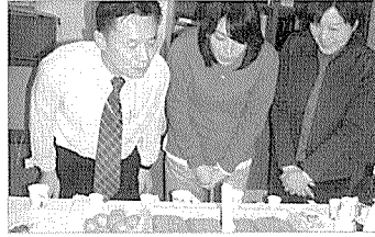
이전 2주년 파티에 앞서 ①