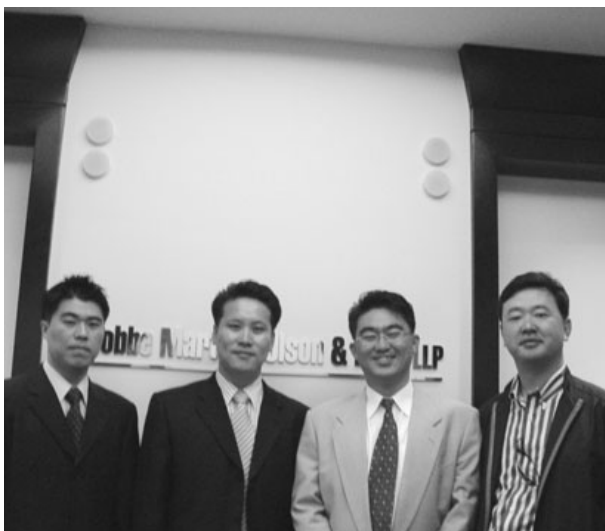
〈Knobbe Martens Olson & Bear LLP 방문〉