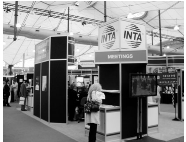
〈INTA 박람회 현장〉

박람회 참가업체는 미국 및 유럽 상표업체가 대부분을 차지했으며 한국 상표관련업체는 아쉽게도 한 곳도 없었다. INTA도 자체 부스를 마련하여 상표위조에 관한 전시 및 INTA 관련 상담을 실시하여 조만간 박람회 참가를 희망하는 정보원 상표조사분석팀의 궁금증을 다소 해결할 수 있었다.