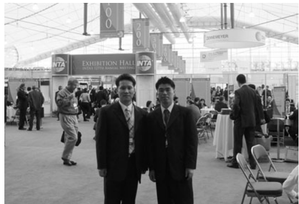
〈INTA 박람회 현장〉

미국 여느 도시처럼 샌디에고도 대중교통이 상당히 발달되어 있었다. 일행이 묵고 있던 호텔과 행사가 진행된 샌디에고 컨벤션센터까지 트롤리(trolley)로 쉽게 이동이 가능했으며 자연친화적인 도시답게 발보아파크(balboa park) 등 다운타운에서 가까운 곳에 공원이 위치하고 있어 휴식