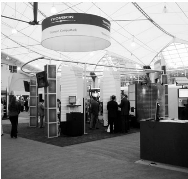
(Brandy International booth 현장)

Brandy International은 국제적인 지적재산정보 제공업체인 Thomson & Thomson社의 자회사로 1995년에 설립되어 아시아지역을 담당하고 있다. online 상표 데이터베이스를 제공하고 있으며, 일본을 포함한 국제적 범위의 상표검색, watching 서비스를 제공하고 있다. 더불어 상표관리 IT solution 및 브랜드 네이밍, 브랜드 가치 평가를 포함한 전반적인 상표 관리 업무를 하고 있다.