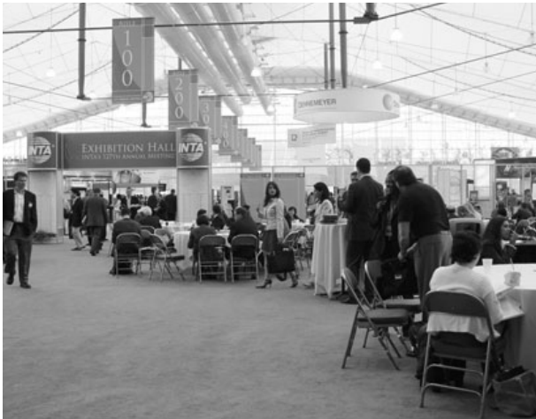
〈INTA 박람회 현장〉

▷ 현재 온라인 검색기관 서비스는 가격, 효율면에서 절대적으로 유리하며 USPTO, CTM 1) 등에서도 편리하고 간단한 무료 검색툴을 제공하고 있다.