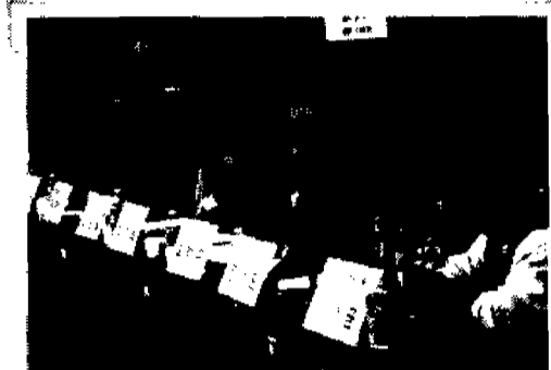
· 위기의 전북농업 위위 해법을 찾기위해...

전라북도, 학계, 농민단체들이 쌀 중심의 전북농업이 최대 위기를 맞고 있다는데 인식을 같이하고 해법을 찾기 위해, 지난달 18일 전북지역농업연구원과 호남사회연구회 주최로 열린 공동 심포지엄이 전북대 농업생명과학대학에서 열렸다.