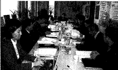
▲양돈협회는 지난 19일 축산환경대책위원회를 개최하고 양돈농가들의 최대 애로사항인 가축분뇨처리 및 냄새에 대한 대책 등을 논의했다.