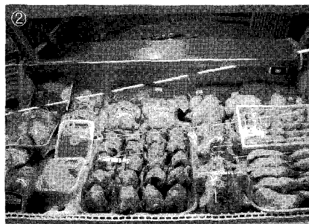
① 일본에서 판매되는 브라질산 드럼스틱 ② 브라질산 포장육