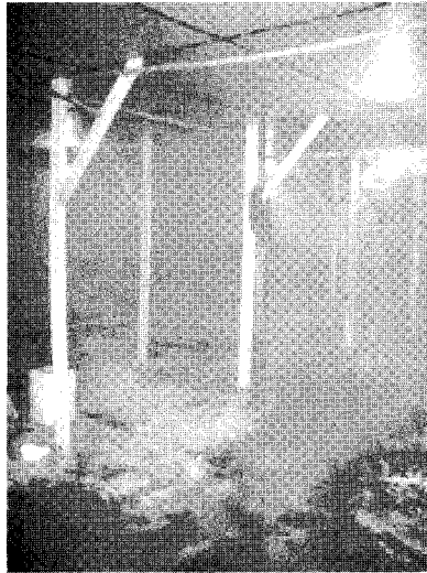
〈그림 2〉 연무소독 직후 계사 내부 모습

가능하며, 포르말린과는 달리 연무 소독 후 30~60분 후에 병아리를 입추할 수 있다. 계사 입구에는 발판 소독조를 설치한다. 발판 소독조는 2개를 설치한다. 물로 된 것 하나와 소독약을 담은 것 하나를 설치하여 물에서 먼저 먼지, 유기물 등을 제거한 후 소독약을 밟고 계사 안에 출입하도록 한다.