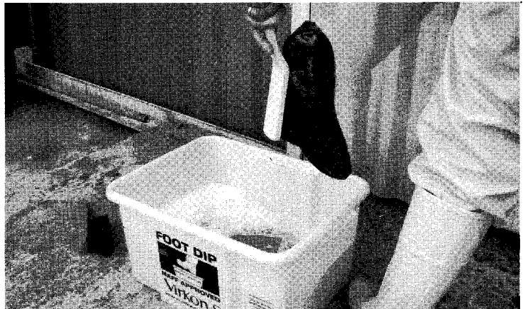
〈그림 3〉 발판 소독조에서 신발을 세척·소독하는 모습. 소독조 옆에 솔을 두어 신발에 묻은 흙이나 유기물을 세척하고, 소독을 한다.