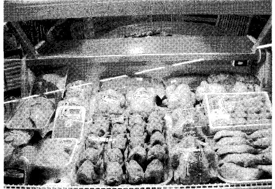
브라질산 닭고기 가공품

지난해 한국의 검역단이 브라질을 방문 4개의 공장을 현장 검역한 적이 있다. 그들의 업체는 다음과 같으며, SADIA의 경우 한국의 총 생산량에 버금가는 생산능력을 자랑하고 있다.