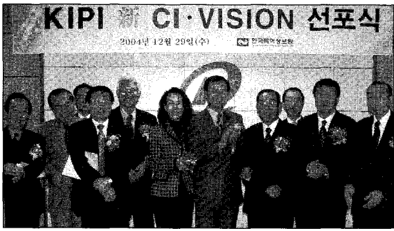
한국특허정보원이 창립 10주년을 맞아 세계적인 특허정보서비스 전문기관으로의 도약을 위한 '신 CI·VISION 선포식'에 참석한 내빈들.