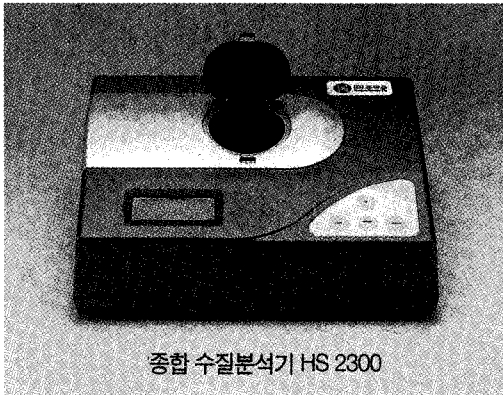
종합 수질분석기 HS 2300

(주)휴마스에서 판매하던 HS 2000을 개선한 것으로 기존에 측정항목이 18개 이던 것을 총 36