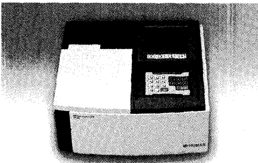
종합수질분석기 HS 3300

HS 3300은 수질분석 항목 약 70여개를 측정할 수 있으며, V-type의 경우 Visible spectrophotometer로, U-type의 경우 UV spectrophotometer로 사용하여도 선진국제품에 비해 전혀 손색이 없는 제품이다. 따라서 HS 3300U의 경우 기존의 습식분석에도 이용될 수 있다. 본 제품은 광밴드폭, 산란광, 재현성, 정밀성, 디자인 등에서도 선진국의 제품에 비해 동등 이상의 특성을 가지고 있다. 또한 개발과정과 제조 과정에서 원가절감에 성공하여 선진국의 동급 제품에 비해 크게는 50~60%에 판매하고 있다.