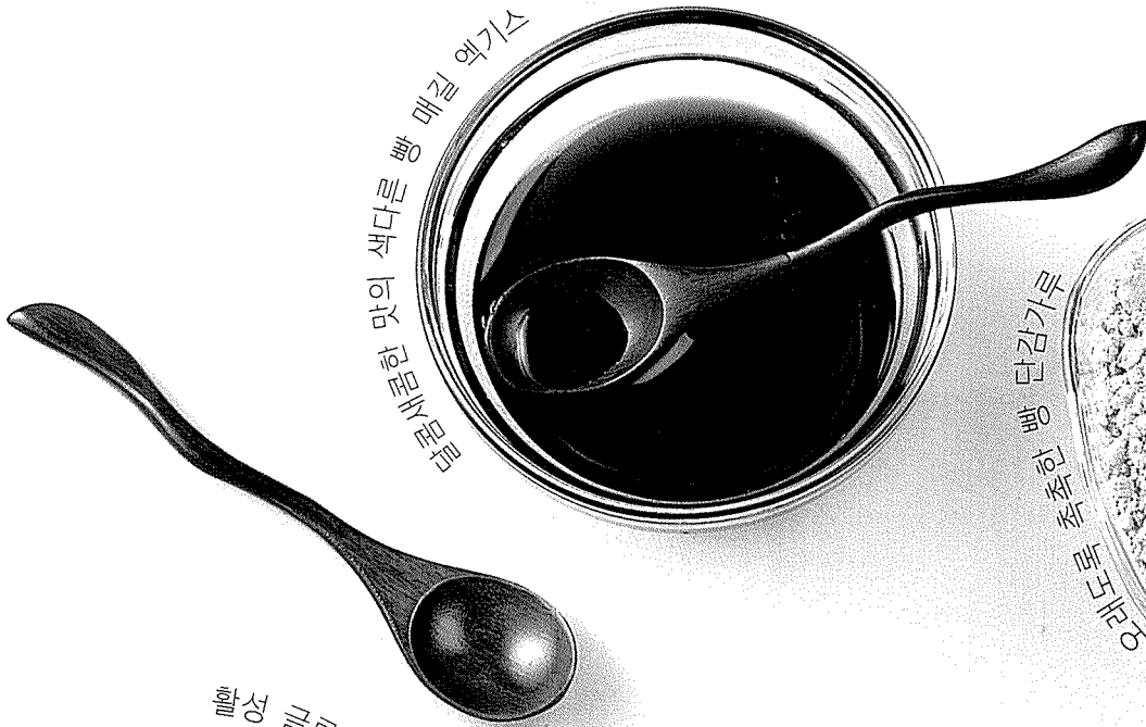
본물새물엿의 색다른 빵 매질 약기스