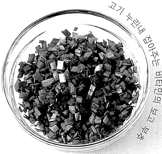
고기 누린내 잡아주는 비타민이 없고 부추는