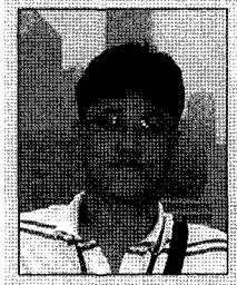
글 | 장호철 (주)진로

자원의 절약과 환경보존에 대한 국민적 관심이 집중됨에 따라, 폐기물의 발생을 생산단계에서부터 억제하고 발생된 폐기물의 재활용을 촉진하기 위하여, 생산자와 소비자가 폐기물에 대한 책임을 합리적으로 분담할 수 있는 재활용체계를 수립하려는 공감대가 형성되어, 2002년 2월「자원의 절약과 재활용 촉진에 관한 법률」 전면개정됨에 따라 시행된 생산자책임재활용제도(EPR)에 대한 이해를 돕고자 생산자책임재활용제도의 전반적인 고찰 및 재활용의무생산자인 (주)진로 생산자책임재활용제도의 이행방법에 대해 간단히 살펴보기로 한다.