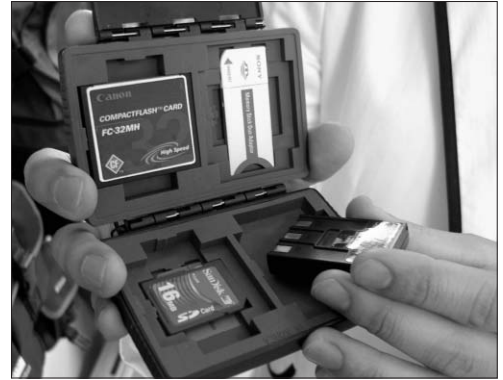
▶배터리와 메모리카드 등을 실속있게 수납이 가능한 디엔제이클럽의 메모리케이스

처음 직원 4~5명에서 시작한 이 회사는 현재 12명으로 늘어났고 사세 확장에 따라 신규채용을 늘리는 중이다. 올해 총매출 목표는 50억으로 잡은 가운데 이중 수출목표만 10억을 잡았다. 올해 가방공장 인수에 이어 삼각대 공장까지 인수를 마치면 내년 총매출 100억 가까이도 가능하다는 게 자체 예상이다. 디엔제이클럽은 삼각대 공장 인수에 이어 북경, 상해 쪽에 연락사무소를 개설하여 중국 내수시장도 공략하겠다는 목표도 세워두고 있다.