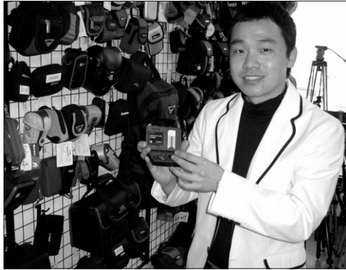
▶디엔제이클럽 제품전시실에서 이 회사 직원이 메모리카드 케이스를 직접 선보이고 있다.