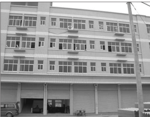
▶중국 광저우에 위치한 디엔제이클럽의 가방 생산 공장 전경