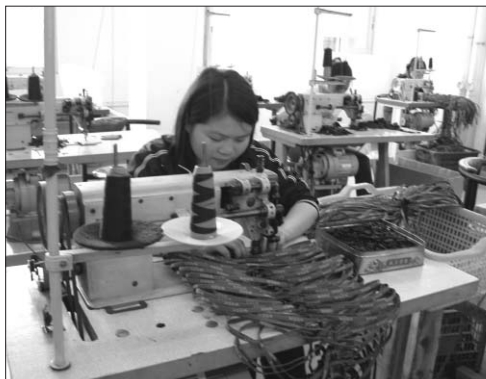
▶중국 공장 생산부 직원이 가방제작을 하고 있는 광경