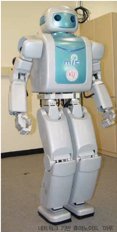
네트워크 기반 휴머노이드 '미루'

이런 관점에서 로봇의 상품화를 위해서는 낮은 가격의 로봇을 개발하여 핸드폰과 같은 단말기 형태로 보급하고, 이 로봇을 통해 다양한 서비스 콘텐츠를 유비쿼터스 네트워크를 통해 실시간으로 제공할 수 있는 새로운 개념의 ‘유비쿼터스 로봇’ 혹은 ‘네트워크 기반 로봇’의 개념이 정보통신부의 ‘지능형 서비스 로봇’ 사업을 통해 제시되었다. 이동통신 및 인터넷의 보급과 함께 유무선 통신기술의 급속한 발달로 네트워크 인프라가 급속하게 확산되면서 ‘네트워크 기반 로봇’의 개념이 설득력을 얻고 있으며, 이와 더불어 네트워크 기능을 활용하여 외형적으로는 로봇의 모습을 갖추지 않고 있으나, 지능을 갖추고 환경 속에 내장되어 사람들에게 다양한 정보와 서비스를 제공할 수 있는 새로운 형태의 내장형 ‘유비쿼터스 로봇’ 및 ‘로봇 에이전트’와 같은 지능형 서비스 로봇에 대한 관심도 증가하고 있다.