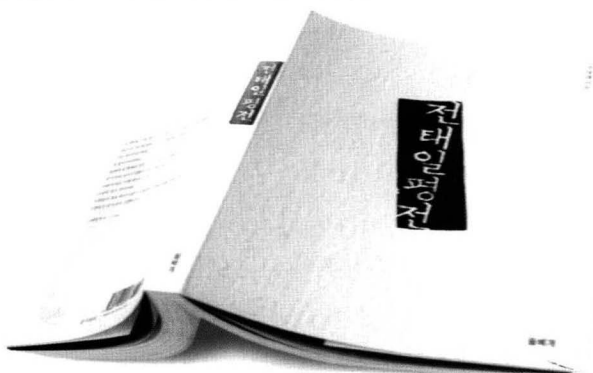
《전태일 평전》 조영래 지음 | 돌베개 | 320쪽 | 값 9,000원

1970년 11월 13일 모든 노동자의 존엄 회복을 외치며 평화시장 앞 길에서 분신 산화한 전태일이 되살아난 곳은 골방이다. 사회개혁가이자 인권변호사로 활동했던 조영래(趙英來· 1947~1990)는 민청학련 사건으로 수배생활에 있던 1974년 전태일을 살려내기 위해 펜을 들었다. 1983년 '어느 청년 노동자의 삶과 죽음' 을 제목으로 달고 출간 된 전태일평전(당시 제목은 《어느 청년 노동자의 삶과 죽음》이었다) 초판본은 '전태일 기념관 건립위원회' 로 나와야만 했다. 전태일의 죽음을 기억하는 것조차 금지 되던 시절이었다.