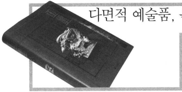
《옥새》 민홍규 지음 | 인디북 | 376쪽 | 값 55,000원