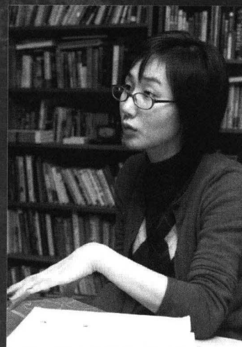
‘보는 책’을 지향하는 두 책의 편집 과정을 설명하는 편집부 천장은 씨.