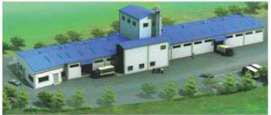
총체보리 사료공회 본부

하늘과 땅이 맞닿은 지평선 우리나라 최대의 평야지대, 혼성 회자되는 웰빙시대와 보리 그리고 한우 전북 김재이 소재한 전북한우협동조합에서 향수의 건강곡물 보리를 사료로한 “총체보리 한우”라는 고품질 한우 브랜드로 우리 먹거리 시장에서 새롭게 자리잡고 있다.