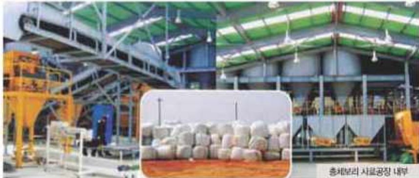
총체보리 사료공장 내부

전북하우협동조합의 총체보리를 이용한 섬유질 사료공장은 총사업비 17억원(국·도·시비 13억 6천만원, 자부담 3억 4천만원)을 투자, 김제시 황산면 쌍검리 인대 4,300여평에