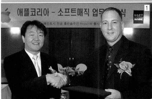
1. 애플 소프트매직 제휴 2. 아카데미

바로 신개념의 워크플로가 국내 시장에도 정착을 시도한 것이었다. 하지만 한글 작업 환경에서의 호환성이 가장 큰 키워드로 다가왔다. 이를 극복하기 위해 서체 개발에 주력하며 'SM' 폰트를 개발하게 된다. 가장 큰 관건이 바로 PS 환경에서 얼마나 발 빠른 적응을 보일 수 있느냐라는 것이었기 때문이다. 이를 바탕