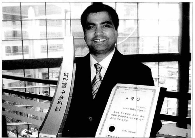
▶ 지난해 11월26일 '무역의 날' 행사에서 1백만불 수출탑에 죽산기계가 선정됐다.

면 기계의 관리에 있다. 현재 동남아시아 기술자들은 한국에 와서 오프셋 인쇄기 유지 및 보수에 대해 배우고 돌아간다. 그만큼 국내 인쇄 기술이 일정한 수준에 올라 있다는 것을 의미한다.