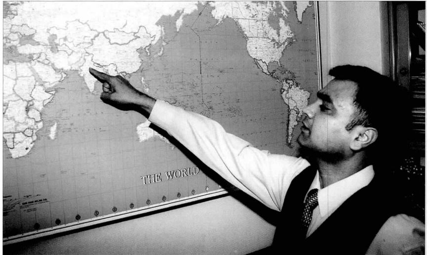
▲ 하류 아이볼 에스 사장이 인도 등 주요 수출국들에 대해 설명하고 있다.

그때의 경험이 지금은 노하우로 쌓여 현재는 현지의 에이전트와 긴밀한 연락을 통해 각 국가별 수출·입 동향을 수시로 점검하고 있다. 항상 긴장의 끈을 놓지 않고 있다는 뜻이다. 하지만 수출 시 무엇보다 안타까운 점을 굳이 꼽으라