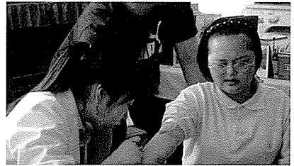
▲ 경기지부 무료검진 현장