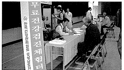
▲ 경남지부 무료검진 현장