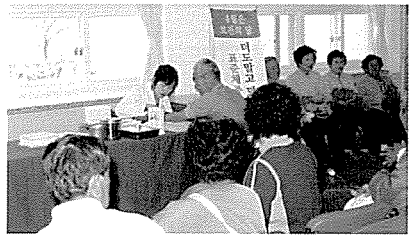
▲ 경북지부 무료검진 현장