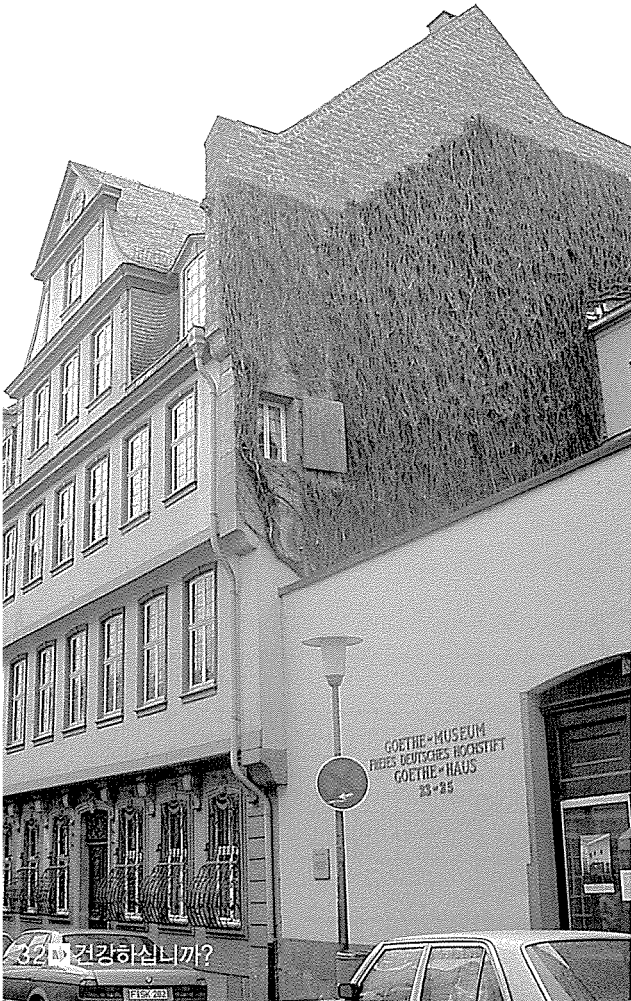
▼ 괴테의 집과 박물관. '젊은 베르테르의 슬픔' '파우스트' 같은 명작을 저술한 괴테는 독일사람들이 아끼는 문인이다.

이 있었다. 다재다능한 괴테는 해부학 분야에서 뛰어난 업적을 남긴 과학자였고, 배우들에게 연기 지도를 하기도 했다고 한다. 괴테 하우스(Goethehaus), 괴테가 살았던 생가와 그의 유품을 모은 괴테 박물관이 있는 이곳은 카이저 광장 뒤편에 조용히 자리잡고 있다.