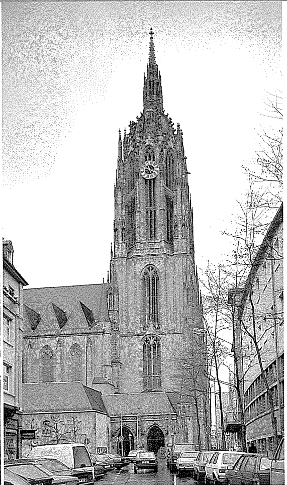
▼ 과거 황제들의 대관식을 거행했던 유서깊은 대성당의 모습