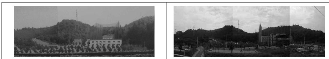
그림 4. 안산 시민공원 조성계획.