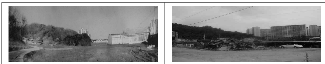
그림 5. 군포 당동지구 토지구획정리사업.