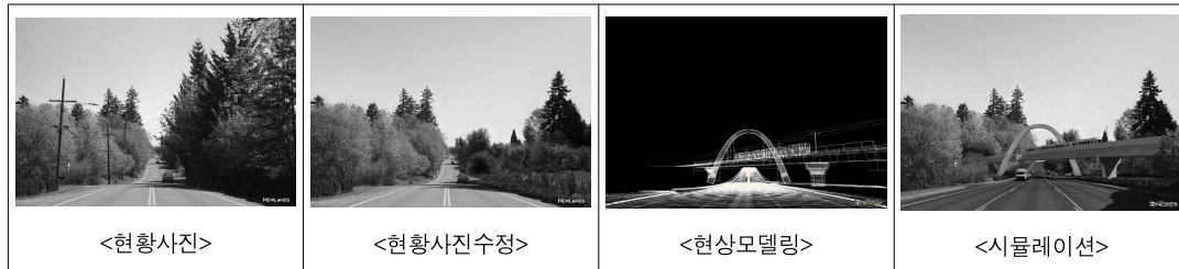
그림 1. 경관시뮬레이션의 적정성 검토.