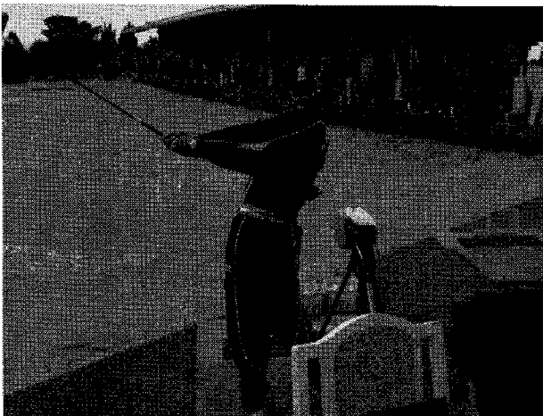
그림 1. 실험장면