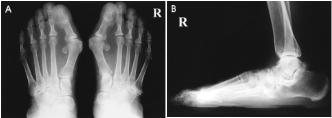
Figure 1. Preoperative radiographs. (A) Standing AP radiograph shows shortening of lateral column, forefoot abduction, talus medial tilting and hallux valgus. Talocalcaneal angle is 40^\circ and cuboid abduction angle is 18^\circ . (B) Standing lateral radiograph shows loss of medial longitudinal arch, talus tilting in plantarflexion position, talonavicular and naviculocuneiform joint sagging. Talocalcaneal angle is 35^\circ , calcaneal pitch angle is 6^\circ and talus-1st metatarsal angle is 12^\circ .

고, too many toes sign이 나타났으며, 경도의 뒤꿈치 외반(heel valgus)이 있었다. 방사선학적으로는 체중부하 전 후면상에서 거골이 내전(adduction), 입방골은 외전 되어