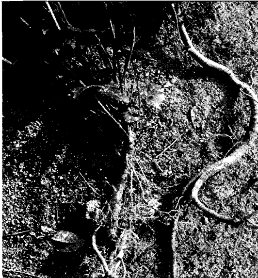
Fig. 3. Comparison of root shape of both plants after one year. The right plant is grown after germination and left plant is grown after propagation by root cutting.

** : significant at the 1% level. *** : significant at the 0.1% level. ns : non significant at the 5% level.