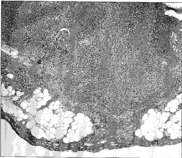
Fig. 2. A pathology finding of metastatic papillary carcinoma of the thymus. The tumor is characterized by papillary structures with fibrovascular cores and nuclear features of papillary carcinoma, including prominent nuclear grooves (Hematoxylin-Eosin, original magnification \times 40 ).

ml 였으며, 경부 초음파 검사에서 우측 갑상선 상부에 0.5×0.5cm 크기의 종괴가 2개 관찰되었고, 중간에 1.5×1.4cm 크기의 종괴가 관찰되었다. 좌측 갑상선 상부에도 0.5×0.5cm 크기의 종괴가 관찰되었으며 우측 측경부에 1.0×0.9cm 크기의 방대해진 림프절이 관찰되었다. 재원 6일째 흉선 절제술을 시행하였으며 수술후 16일째 갑상선 절제술과 중앙 경부림프절 청소술, 우측 광범위 경부 림프절 청소술을 시행하였다. 조직병리 검사에서 흉선종은 전이성 유두상 갑상선암으로, 좌측 갑상선은 양성 결절로, 그리고 우측 갑상선과 중앙 림프절, 우측 경부 림프절은 유두상 갑상선암으로 판명되었으며 피막 침범 소견을 보였다(Fig. 2). 호흡근육 마비등의 특별한 합병증 없이 수술후 30일째 30mCi 방사성 요오드 동위원소 치료를 받았으며, 수술 후 4개월째인 현재까지 건강한 상태로 외래 추적 관찰 중이다.