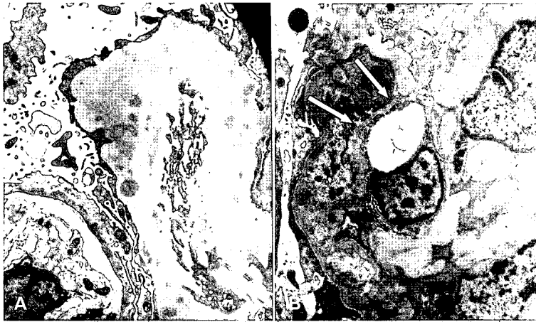
Fig. 3. Electron microscopic findings. A) Some electron-dense deposits are noted in the subendothelial and subepithelial spaces. B) New basement membrane formation(arrow) with mesangial interposition.

converting enzyme(ACE) 차단제를 복용하였다. 스테로이드를 복용하기 시작하면서 혈당 조절을 위해 인슐린 용량을 증량하였다. ACE 차단제를 복용한 후 발진이 나타나 angiotensin II 수용체 차단제로 변경하여 복용 중으로 치료 시작 후 4개월경 요 단백/크레아티닌 비는 0.96으로 감소하였다. 8개월째에 경구용 스테로이드를 감량(deflazacort 6정 QOD)하여 복용을 지속하였다. 1년째 검사한 요 단백/크레아티닌 비는 4.77이었고 요검사상 요비중 1.025, 요단백 3+, 잠혈 3+, 요당은 음성이었으며, 적혈구 50-99/HPF, 백혈구 5-9/HPF이었다. 혈액 화학 검사상 총단백 4.3 g/dL, 알부민 2.2 g/dL, BUN 15 mg/dL, creatinine 0.8 mg/dL, HbA1c 6.8%였고 C3 49 mg/dL(참고치: 70-150), C4 20 mg/dL(참고치: 10-35) 이었다.