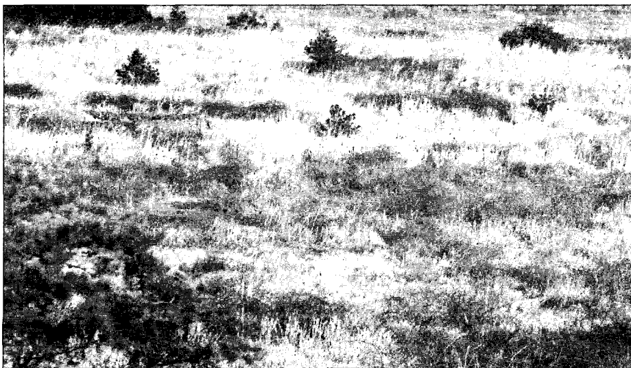
Figure 3. The primary habitat of Bibari snake( S. collaris ) in Jeju Island, Korea

주요 식생은 참억새( Miscanthus sinensis ), 락죽( Imperata cylindrica var. koenigii ), 솔새( Themeda triandra var. japonica ), 개솔새( Cymbopogon tortilis var. goeringii ), 잔디( Zoysia japonica ) 등의 초본식물과 청미래덩굴( Smilax china ), 찔레꽃( Rosa multiflora ), 보리수나무( Elaeagnus umbellata ), 국수나무( Stephanandra incisa ) 등의 관목들이 대표적으로 출현하고 있다