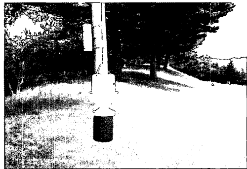
그림 3. 풍뎠이 방제를 위한 페로몬 트랩의 대량설치

페로몬이란 같은 종의 다른 개체와 의사소통을 위해 분비하는 화학물질로, 이 중 암컷이 수컷을 유인하기 위해 분비하는 성페로몬이 가장 많이 쓰이고 있다. 성페로몬 트랩을 대량 설치하여 풍뎠이 수컷을 유인 · 포획함으로써 직접적으로 성충의 밀도를 억제하고 교미 활동을 방해하여 다음 세대의 발생수도 줄일 수 있다. 다만 효과적인 방제를 위해서는 페로몬의 종특이성이란 특성상 대상 해충의 정확한 동정이 필수적이다. 정확한 해충의 동정을 거쳐 페로몬 트랩을 적기에 설치할 경우에는 방제효과가 의외로 크다.