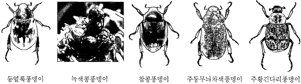
그림 2. 골프장에서 발생하는 주요 풍뎠이 종류

맑은 날 쉽게 관찰할 수 있다. 반면에 등얼룩 풍뎠이는 주로 밤에 활동하며 낮 동안에는 관목류의 그늘 등지에 숨어 있기 때문에 개체수가 많은 경우에도 주의해서 관찰하지 않으면 쉽게 발견하기 힘들다. 골프장에서 발생하는 풍뎠이중 한국잔디류로 이루어진 페어웨이 및 러프에 가장 큰 피해를 주는 종이다.