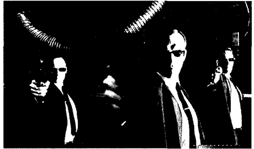
<그림1> 시오원/ 영화 매트릭스 단순성 표현 http://www.movist.com/movies

에 검은색 넥타이를 한 검은색 슈트이다. 이는 단순성과 절제성을 표현하고 있다. <그림1>의 제복은 단순한 스타일과 무채색의 사용으로 단순함과 절제성을 잘 표현해주고 있다.