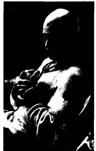
<그림4> 모피어스/ 매트릭스 자연성표현 http://www.movist.com/movies

사이버 전사, 트리니티(Trinity)의 의상을 보면 가죽 탑과 팬츠, 코트, 블랙캣 슈트(Black cat suit)로 바디 컨셔스 라인이며 미니멀한 스타일이다. 클럽에서 네오를 만났을 때 입었던 가슴 바로 위까지 파인 검은색 드레스, 그리고 네오와 함께 모피어스를 구하러 갈 때 입은 바디 컨셔스 라인의 가죽 탑과 팬츠는 인체의 선을 그대로