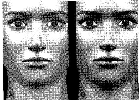
Fig 2. A, Frontal views of standard image; B, image with a 4 mm change from stomion to the chin.

인 기준을 세우기 위한 연구는 이미 많이 발표되었으며, 안모의 비례관계, 입술과 턱의 형태, 보기 좋은 측모를 형성하는 각도나 비율을 규명하기 위한 많은 보고들이 있었다. 8-11