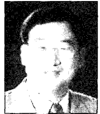
홍 국 희 세민환경연구소