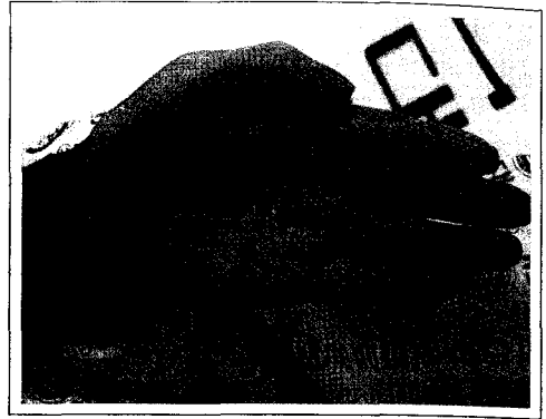
Fig. 3. Left palm(2005.02.26)