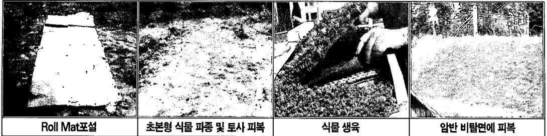
사진 2. 압반 비탈면 시공(Vec Tech co.in Sweden)