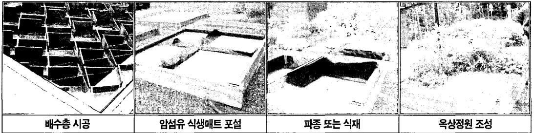
사진 1. 옥상정원 조성(Vec Tech Co., in Sweden)