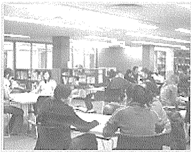
▲ 조용히 토론하는 그룹들