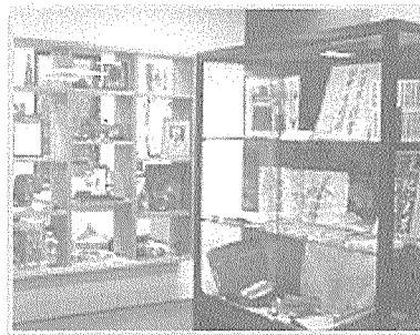
▲ 아시아 연구도서관(ASRC) 디스플레이