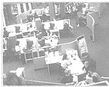
▲ 참고봉사데스크와 그 주변