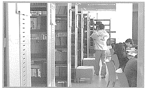
〈3층 종합자료실. 모든 주제분야의 단행본, 연속간행물, 참고자료 등을 소장. 세련된 서가 사이사이로 배치된 인체공학 책상과 의자가 눈에 띈다.〉