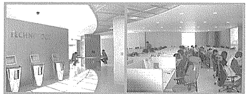
〈2층 디지털자료실. 인터넷 코너 30석, 멀티미디어제작 코너 2석, 원문 DB코너 4석, A/V코너 10석, 노트북 코너 2석, 오디오 코너 2석, 프린터 코너 1석 등 50여대의 컴퓨터를 통하여 멀티미디어 자료와 디지털콘텐츠를 이용할 수 있다.〉