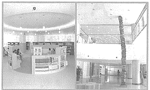
〈1층 가족열람실. 어린이인터:〈1층 로비에 전시된 조형물 '책'〉 넷 코너 6석, 가족영화감상: 코너 16석 및 유아방이 있다.〉