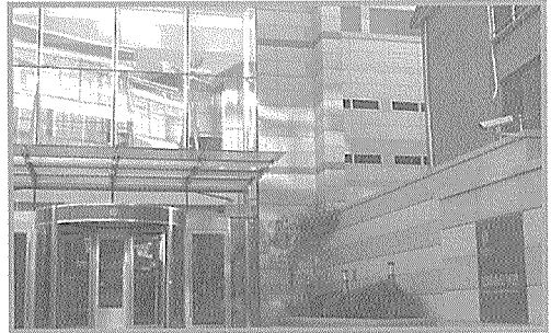
〈도서관 전경 오른쪽으로 도서관 현판이 보인다.〉