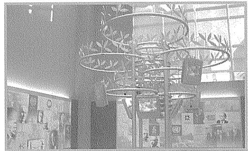
〈1층 로비에 전시된 조형물 "평화의 나무"〉