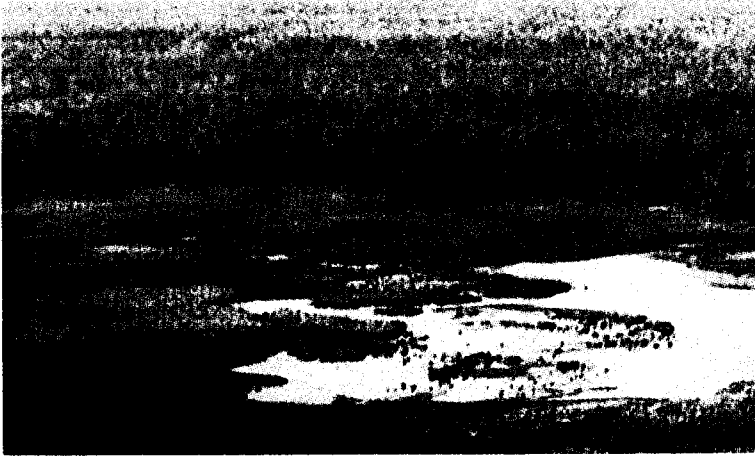
[ River Red Gum ]

넷째날은 공급자와 물 사용자들의 물사용 절약 방안과 염해 예측모델의 개발 및 염해 진행 과정에 대한 발표가 진행되었다.