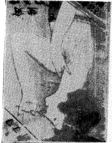
1920년 음화(요리집 홍보용) - 여성신체를 상징하는 그림으로 거꾸로 편집함.