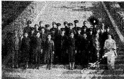
운송회사 (1937년 울산 자동차 부산 영업소직원 일동)