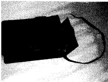
당시 버스차장 가방

이러한 시기에 여성의 사회참여 현상을 신문이 자주 기사화 함으로써 이슈화 하였고 당시 유행했던 '강연회'도 연사 중에 여성 한, 둘을 끼워 넣어야 성공할 수 있었다. 당시 여성 명사가 주로 다루었던 논제는 '조혼문제'와 '남녀차별'이었다. 또한, 일본대기업 자본이 국내에 들어오면서 '식민지 이식공업화'가 되기 시작했고 이로 인해 공업생산지인 도시가 '근대도시화'되면서 이전 농촌사회에서 볼 수 없었던 직업인인 회사원, 공원, 관공리(공무원)등이 도시의 중요한 구성원으로서 자리잡기 시작했다.