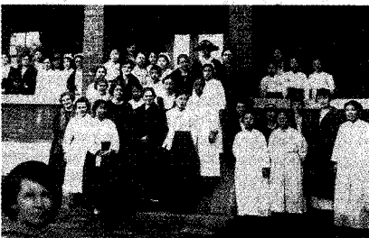
조선간호부회 (1923년 4월 창립)

특이하게 생긴 이 가방은 무슨 용도인지 모른 채 오랫동안 내 창고에 잠을 자고 있었다. 그런데 이 글을 쓰면서 1938년 '여성'이란 잡지의 삽화에서 '버스걸'이 허리에 차고 있는 이것을 발견한 것이었다.