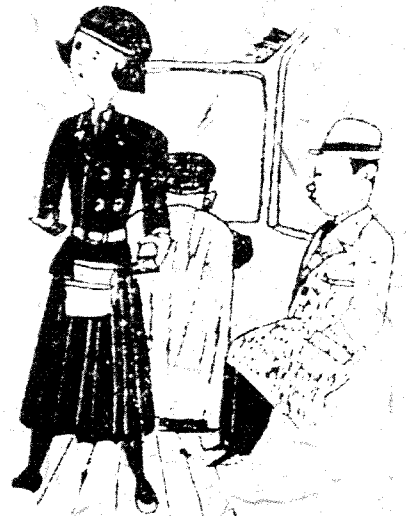
버스걸 (1938년 여성잡지 삽화)