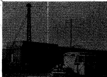
버스 (1930년대 20인승 버스)