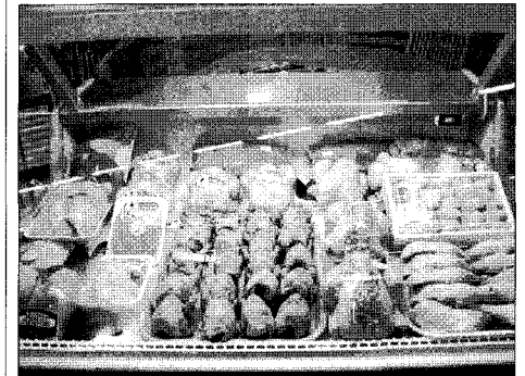
브라질산 닭고기 가공품