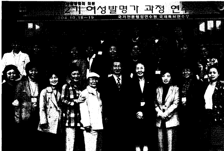
올해로써 두 번째로 개최된 '제2기 여성발명가과정 연수'에 참석한 회원들과 내빈들이 기념촬영하고 있는 모습.